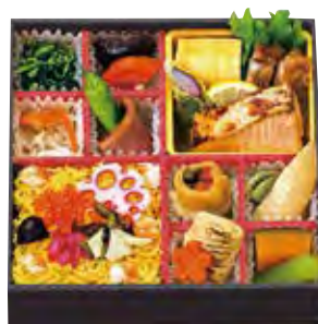
椿 2,250 円