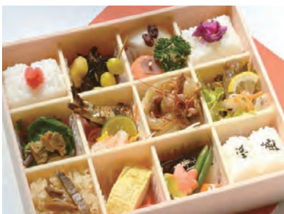
あかね 茜 2,900