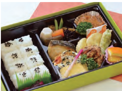
こすもす 秋桜 2,200 円