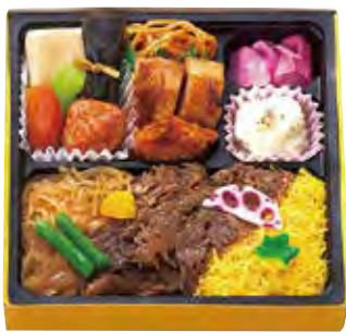
菜の花 1,400 円