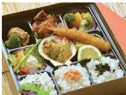
きんもくせい 金木犀 3,500 円