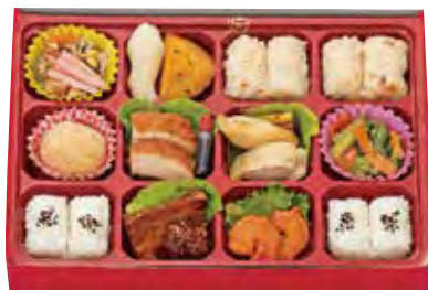
水仙 1,800 円