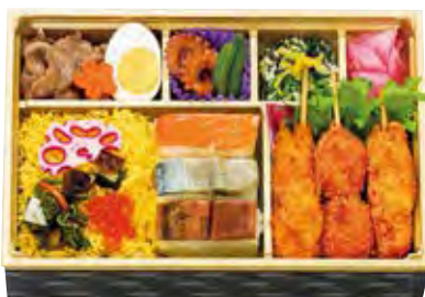
浪花 1,900 円