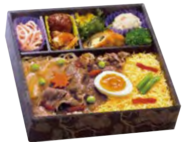
紫陽花 1,900 円