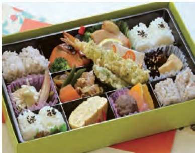
あやめ 菖蒲 2,500 円