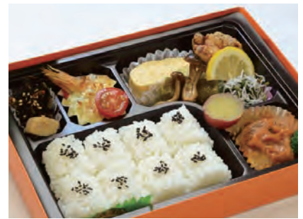
もみじ 紅葉 1,800 円