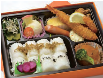
かえで 楓 1,800 円