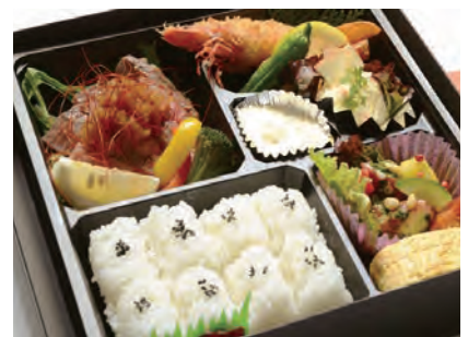
さつき 皐月 3,500 円