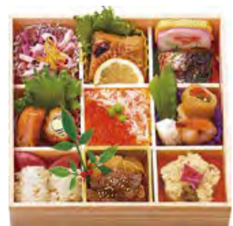
牡丹 2,600 円