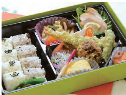
ききょう 桔梗 2,200 円