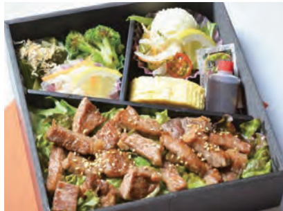
あんず 杏 2,300 円