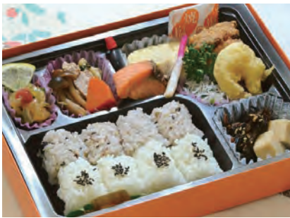
わかさ 若草 1,800 円