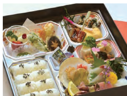
こちょう 胡蝶 4,600 円