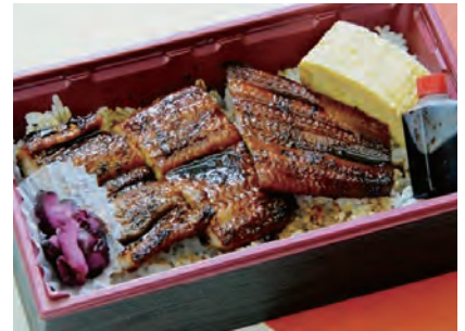
あおい 葵 2,500 円