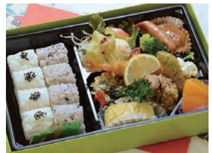
べにばな 紅花 2,200 円