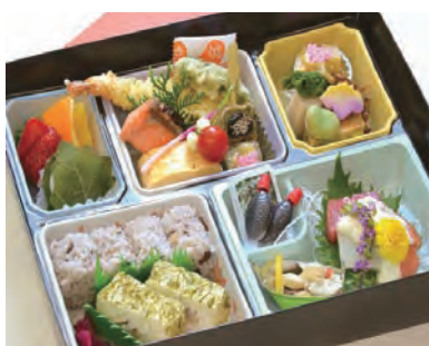
ひなぎく 雛菊 3,500 円