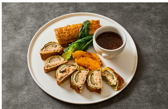
おすすめ魚のパイ包み焼き