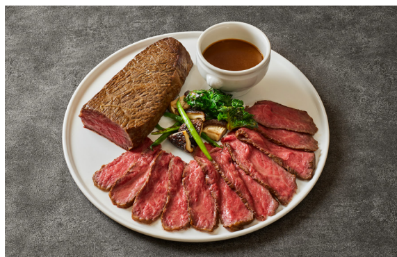
和牛もも肉のローストビーフ