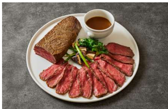
和牛もも肉のローストビーフ