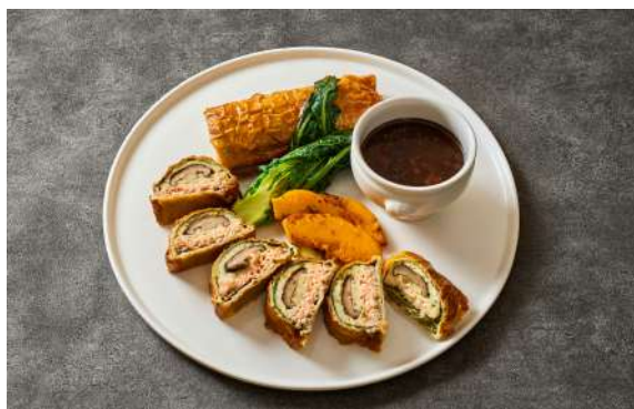
おすすめ魚のパイ包み焼き